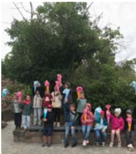
Schulanfängerabschluss auf der Burg Giebichenstein