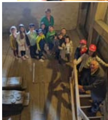
Turmbesteigung in der Petrikirche