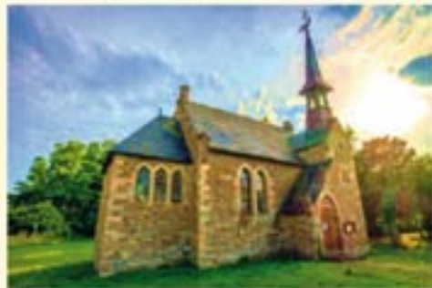
DIE LIEDERTOUR IN DER ST. PETRI KIRCHE ROLLSDORF

Samstag, 19.10. 19.30 Uhr Kirche Rollsdorf