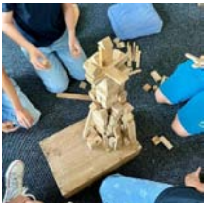
Gemeinschaftsaktion: Wie hoch wird der Turm, bis er umfällt?

Gegenwärtig gehören sieben Konfis zum Kurs und gehen gemeinsam auf Glaubentdeckungstour.